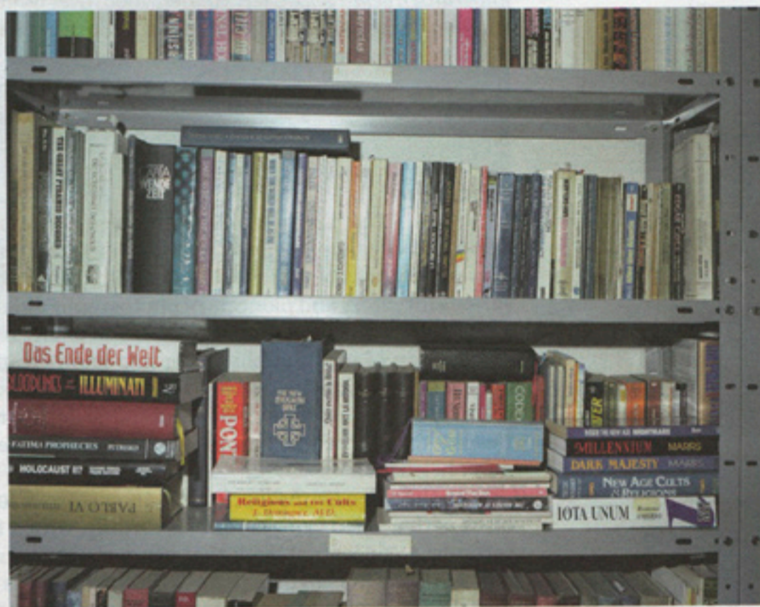
Bibliotheek Juan, april 2007 (2006-2009), dia