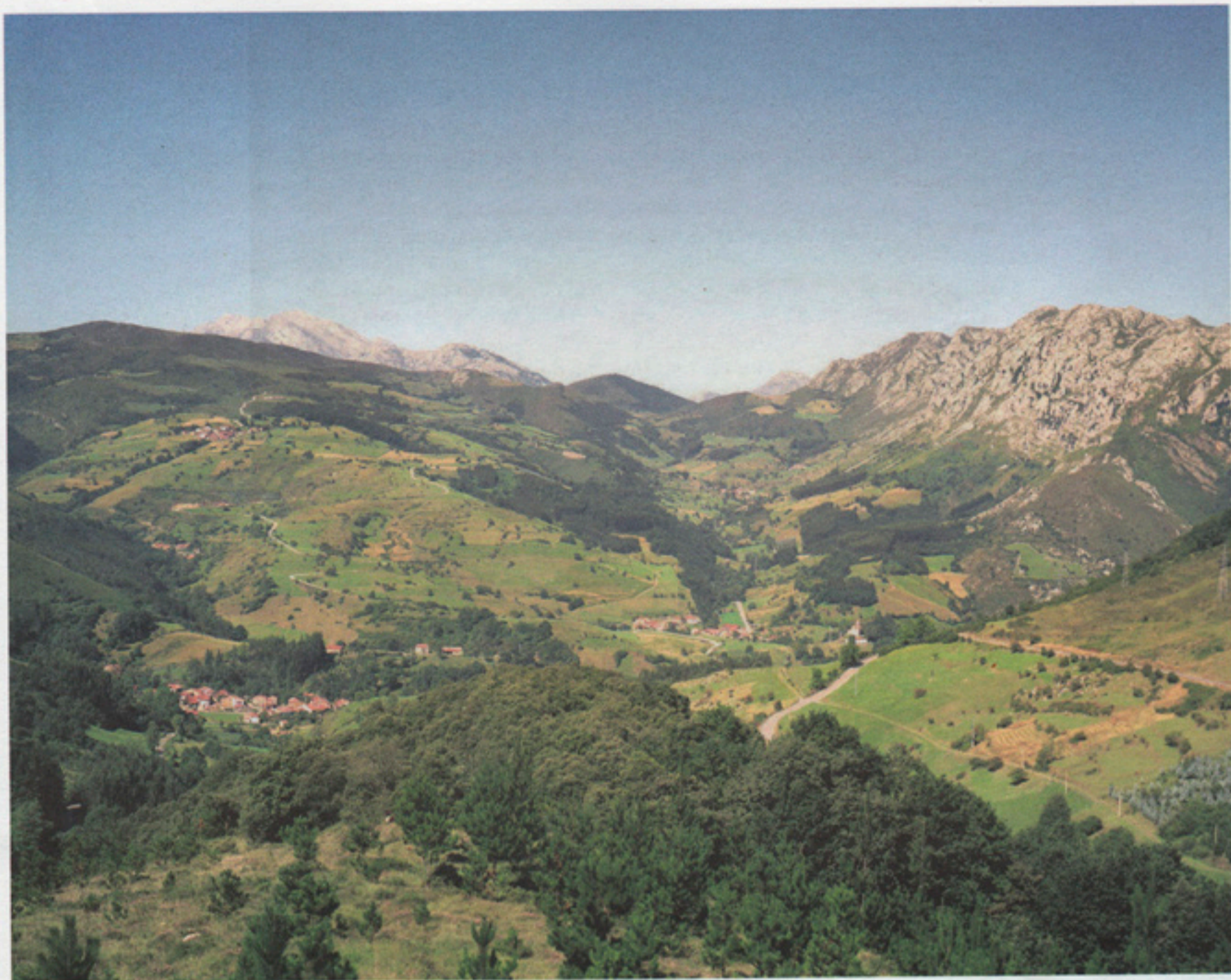
Onderweg richting Potes, augustus 2006 (2006-2009), dia