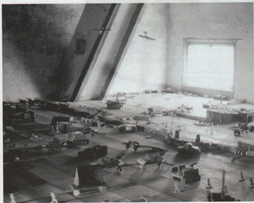
Oorlogstafereel op zol- der ouderlijk huis, 1943 (2006-2009), dia