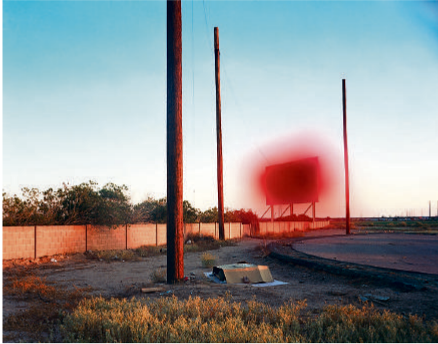
Taiyo Onorato und Nico Krebs (Schweiz) zeigen ein Amerika, das immer «on the road» ist. Johan Willner (Schweden) stellt seine Kindheit nach.

Augenscheinlich wurde dies bei verschiedenen Arbeiten, in denen die Fotografie zur Schöpfung von doppelbödigen Bildern in der Schwebe zwischen Realität und Fiktion eingesetzt wird. «The Great Unreal» heisst denn auch das Buchprojekt der Schweizer Taiyo Onorato und Nico Krebs, einer Arbeit über Amerika, das mythische Leben «on the road» und die damit verbundene Ikonografie, die sie lustvoll